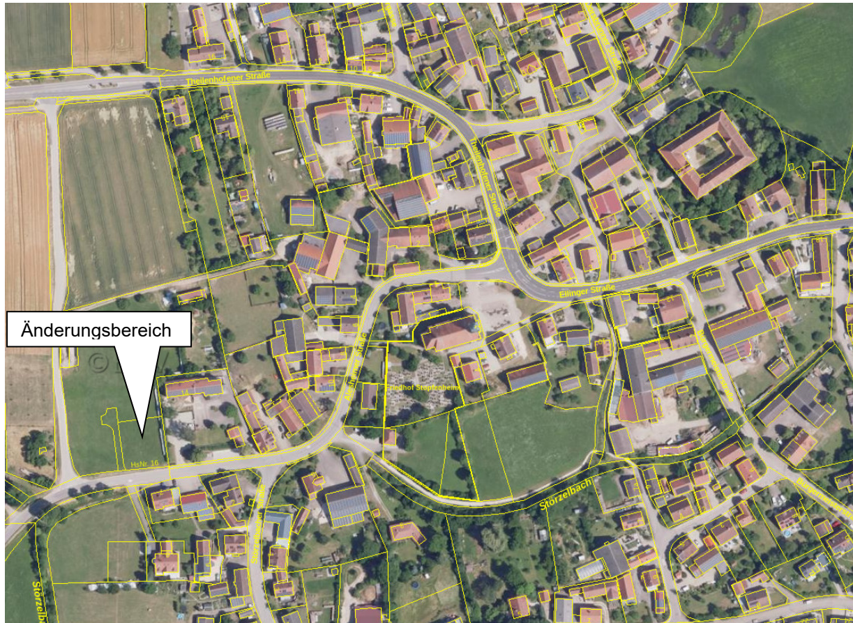
Auszug aus dem BayernAtlas, Luftbild und Parzellenkarte